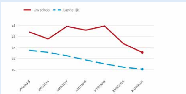
Figuur 1.2 Leerlingen met ouders met een laag inkomen. Op basis van de schooljaren 2014/2015 t/m 2020/2021 2