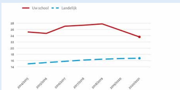
Figuur 1.3 Leerlingen afkomstig uit eenoudergezinnen. Op basis van de schooljaren 2014/2015 t/m 2020/2021 4

De data komt uit het laatst gepubliceerde NRO (nationaal cohortonderzoek onderwijs) document.