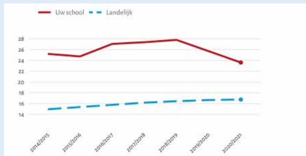
Figuur 1.3 Leerlingen afkomstig uit eenoudergezinnen. Op basis van de schooljaren 2014/2015 t/m 2020/2021 4